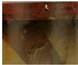
Art. 73820 (40ml) & 26820 (200ml) Snow* / Nieve*

La lluvia arrastra el polvo y la suciedad de forma que ésta deja rastros sobre las superficies de vehículos y objetos, en forma de depósitos en hendeduras o relieves.