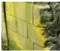
Art. 73828 Wet Effects / Efectos de Humedad

Los líquenes y el moho son efectos de la intemperie. Este producto reproduce el color y la textura moteado de liquen generado sobre piedras y muros. Se aplica con un pincel fino, o bien con esponja para reproducir el moteado.