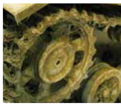
Art. 73827 Moss and Lichen / Musgo y Liqueen

Mud and Grass Effect reproduce la textura que resulta del tránsito de los vehículos sobre hierba y barro. Contiene trazas de vegetación aplastada. Se aplica sobre ruedas o cadenas de los vehículos de combate y sobre dioramas.