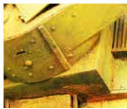
Art. 73822 Slimy Grime Dark / Suciedad Húmeda Oscura

Óxido oscuro que reproduce los tonos anaranjados y el aspecto áspero de un vehículo quemado y abandonado, un techo metálico o un coche en un desguace. Se aplica a pincel o aerógrafo con aguja de 0.4 y presión alta.